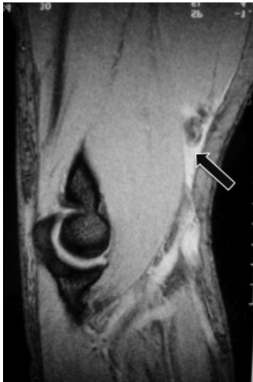
Figura 2 – RNM do cotovelo – corte sagital – que mostra a rotura com retração (seta) da inserção do tendão do músculo bíceps.

foi acometido em nove casos (64,2%) (tabela 1). Em relação ao mecanismo de trauma, todos os pacientes referiram que estavam com o cotovelo fletido e faziam força contra a resistência quando foram submetidos a brusca extensão do antebraço como mecanismo de trauma.