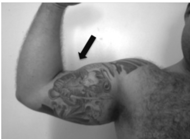
Figura 1 – Imagem clínica que mostra a rotura do tendão distal do bíceps (seta).

Incide, geralmente, em homens entre a quarta e a sexta décadas de vida. 7,10 O mecanismo de lesão mais comum é uma brusca flexão do cotovelo contra resistência com o antebraço em supinação. 7 Normalmente, o paciente relata um audível estalido no cotovelo e uma retração palpável no tendão bicipital. 1 Os sintomas iniciais são dor, edema, equimose, alteração do relevo do braço (fig. 1) e diminuição da força de supinação e da flexão do cotovelo. 11 Se ainda assim houver